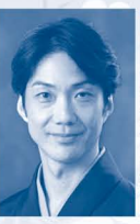
野村 萬斎 のむら まんさい 1966年生、東京芸術大学卒。重要無形文化財総合指定。「狂言ござる乃座」主宰。能狂言公演に出演の他、TV・舞台などでも幅広く活躍。芸術祭新人賞、芸術選奨文部科学大臣新人賞、芸術祭優秀賞等受賞多数。主な著書に「萬斎でござる」、「狂言ライブ〜」などがある。