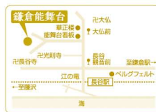
【交通】JR 鎌倉駅よりバスにて15分「長谷観音前」または江ノ電「長谷」駅下車徒歩7分

〒248-0016 神奈川県鎌倉市長谷3-5-13 TEL・FAX.0467-22-5557 URL: http://www.nohbutai.com E-mail: webmaster@nohbutai.com